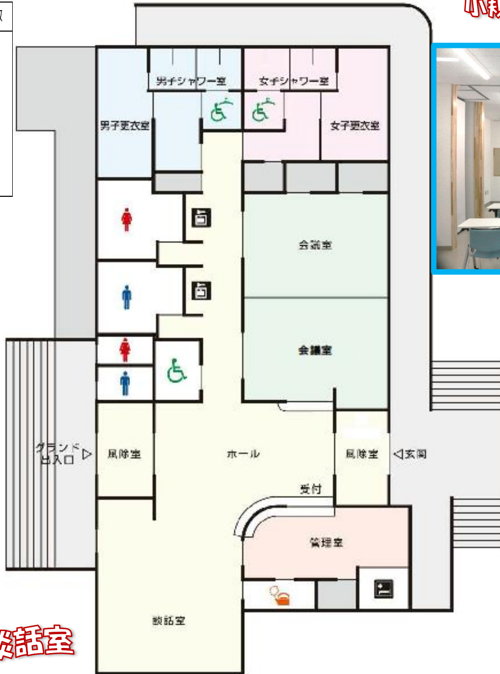
小規模な会議に向いている 明るい会議室