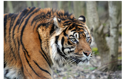
「お正月・とらの本」です。